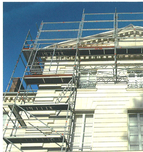
Exemple de réalisation sur un pignon.

La résistance de la protection a fait l'objet d'un P.V. d'essais au CEBTP et s'est vue attribuer la marque NF. Un ancrage par file de montants est nécessaire au niveau du plancher.